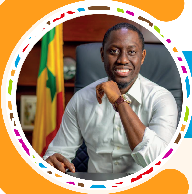
Pape Malick NDOUR Ministre de la Jeunesse, de l'Emploi et de l'Entrepreneuriat